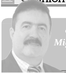
Columna de Miguel Ángel Vega C.