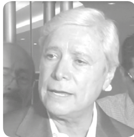
Jaime Bonilla Valdez