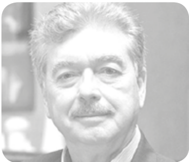
Francisco de Lamadrid