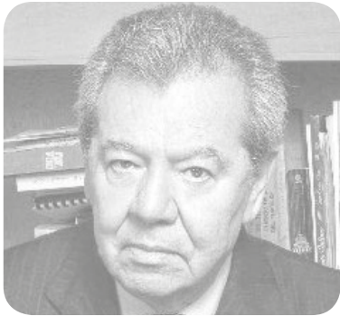
Porfirio Muñoz Ledo