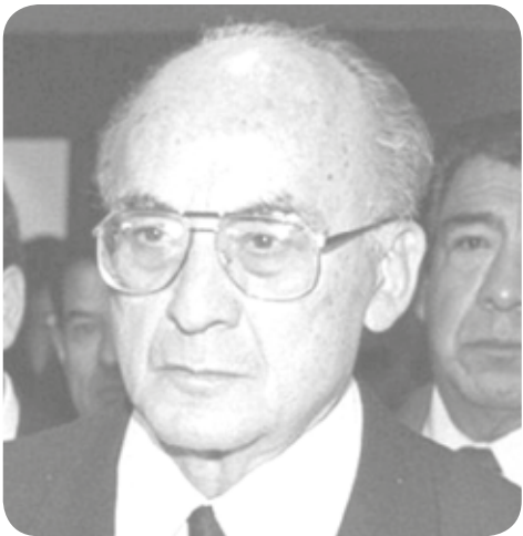
Luis Echeverría Álvarez